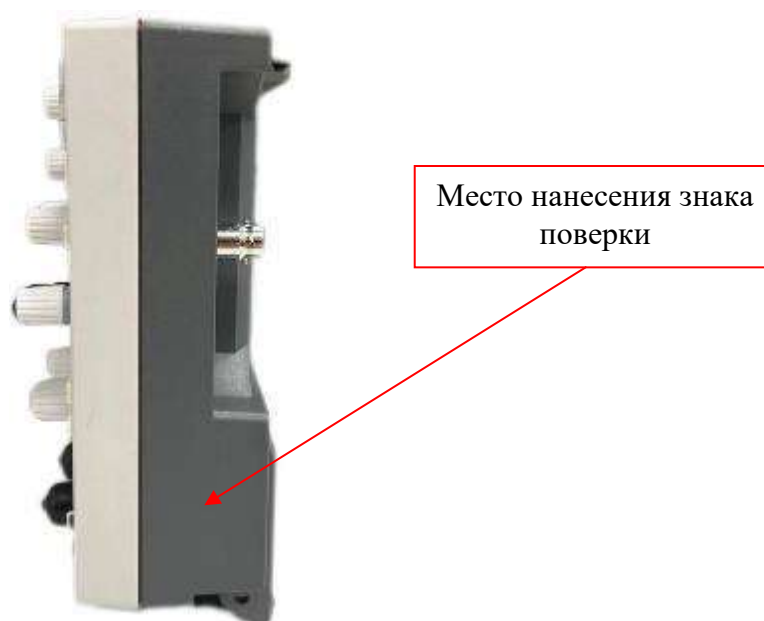
Рисунок 4 – Боковая панель осциллографов RIGOL DH08ZZ