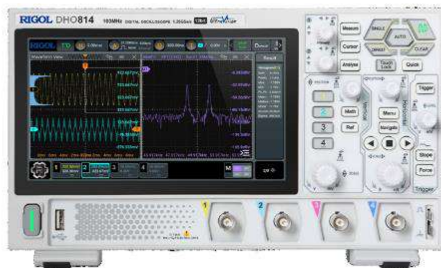
Рисунок 2 – Передняя панель осциллографов RIGOL DH08ZZ для модификаций DH0804, DH0814