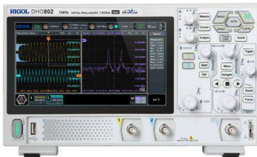
Рисунок 1 – Передняя панель осциллографов RIGOL DH08ZZ для модификаций DH0802, DH0812

Для предотвращения несанкционированного доступа к внутренним частям осциллографов осуществляется пломбирование нижней панели специальными стикер-наклейками.