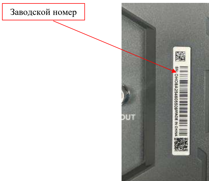
Рисунок 5 – Фрагмент задней панели осциллографов RIGOL DHO8ZZ